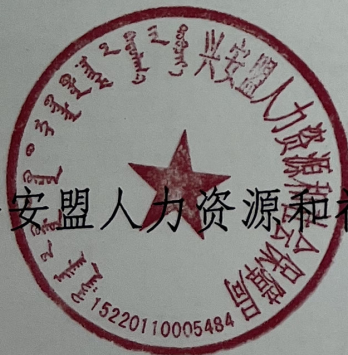
兴安盟人力资源和社会保障局