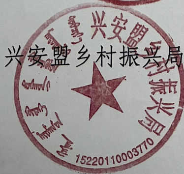
兴安盟乡村振兴局