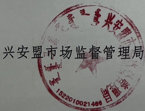
兴安盟市场监督管理局