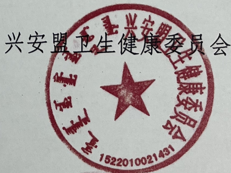
兴安盟卫生健康委员会