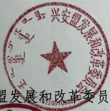
兴安盟发展和改革委员会

附件：《内蒙古自治区发展和改革委员会等 11 部门转发〈国家发展改革委等部门《关于推动家政进社区的指导意见》〉的通知（内发改社字〔2023〕113 号）