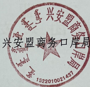
兴安盟商务口岸局